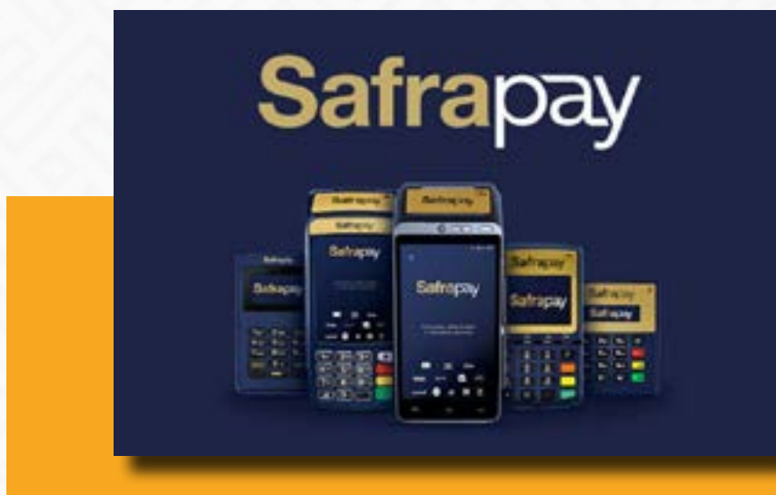
Figura 1: Imagem de representação da Safrapay.