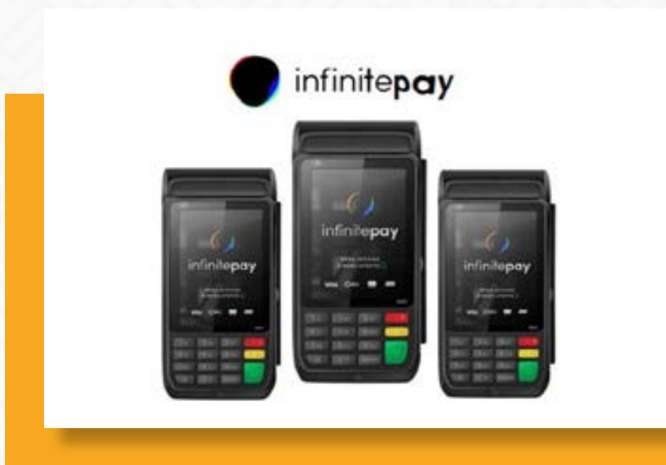
Figura 3: Imagem de representação da InfinitePay